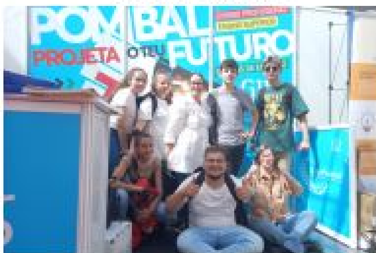
PARTICIPAÇÃO NA MOSTRA DO ENSINO PROFISSIONAL NO 13.º FÓRUM EMPREGO E FORMAÇÃO, EM LEIRIA, DINAMIZADA A PELOS SPO