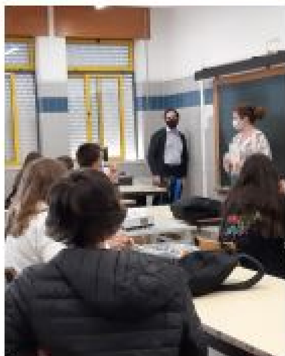
SESSÃO DE APRESENTAÇÃO DOS CURSOS PROFISSIONAIS DINAMIZADA PELOS SPO