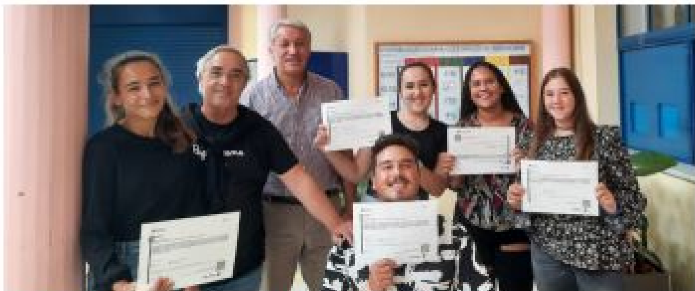
GRUPO DE FORMANDOS APRESENTANDO O DIPLOMA FINAL DO CURSO PROFISSIONAL