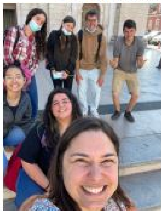
PARTICIPAÇÃO NA SAÍDA DE CAMPO A LEIRIA, INTITULADA A "SER GUIA TURÍSTICO POR UM DIA"

Como espaço importante para estimular as aprendizagens, realizaram-se, sob organização dos SPO, as seguintes Visitas de Estudo: Futurália (30 de março 2022); Qualifica 2022 (21 de abril 2022); 19.ª Edição da Mostra da Universidade do Porto (21 de abril 2022); 13.º Fórum de Emprego e Formação Profissional de Leiria (29 de abril 2022); Expo Fago - Guia e Feira da Juventude de Pombal; FabLab de Porto de Mós.