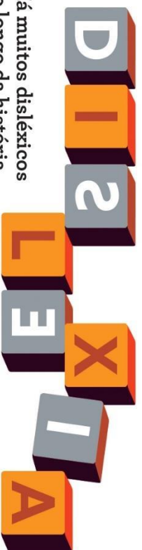
Ilustração: Tiago Albuquerque

Há muitos disléxicos ao longo da história que se tornaram grandes génios!